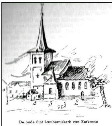
De oude Sint Lambertuskerk van Kerkrade

Tegen elf uur schoof de grendel van de kleine poortdeur. Een groep mannen, van wie er twee een stallantaarn droegen om de weg te verlichten, trad naar buiten. Achter hen deed de boerin, die de hond in bedwang hield, de poort weer op slot. Voorop liep de boer met de oudste knecht. Daarachter de zeven jongens met de overige knechts. Op de rijweg door de ‘huiswei’ waren ze door een hoge doornheg beschut tegen de vinnige kou. Maar eenmaal buiten het hek blies hen de grimmige oostenwind recht in het gezicht, zodat ze huiverend de mutsen dieper in hun hoofd trokken. De veldweg die ze nu volgden, leidde langs het Kaalheiderbos naar de steenweg, welke de abdij met de heerbaan van Maastricht over Heerlen en Drievogels naar Aken verbond. De mannen bleven dicht bij elkaar. Zo beschutte de een de ander een beetje tegen de felle wind. De kerkgangers hoorden de klokken luiden, het was het gelui van de Sint Lambertus, dat de Kerkradenaars ter nachtmis riep. De weg ging bergaf naar de Anstelbeek, waar een andere hoeve van Kloosterrade “de Maelmul in der Brucken”, de tegenwoordige Brughof lag. Nu de Kerkraderberg op. Beneden aan weerszijden diepe ravijnen en verderop de hoge berm van de Wijngracht, donker door het struikgewas. Onwillekeurig liepen de mannen hier dicht naast elkaar. Ze dachten aan