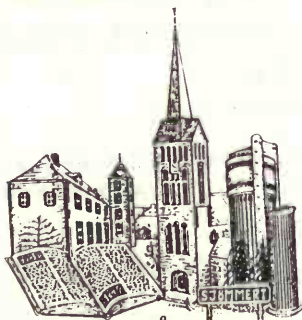
1987 Heemkundevereniging Schimmert