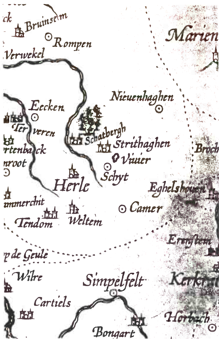
Al op de eerste gedrukte kaart van dit gebied staat Strijthagen met een vijver aangegeven. Kaart van het hertogdom Limburg van Aegidius Martini (1603) naar een uitgave van 1606. (GA Maastricht, coll. Cremers; foto: Harrij Paping, Maastricht).